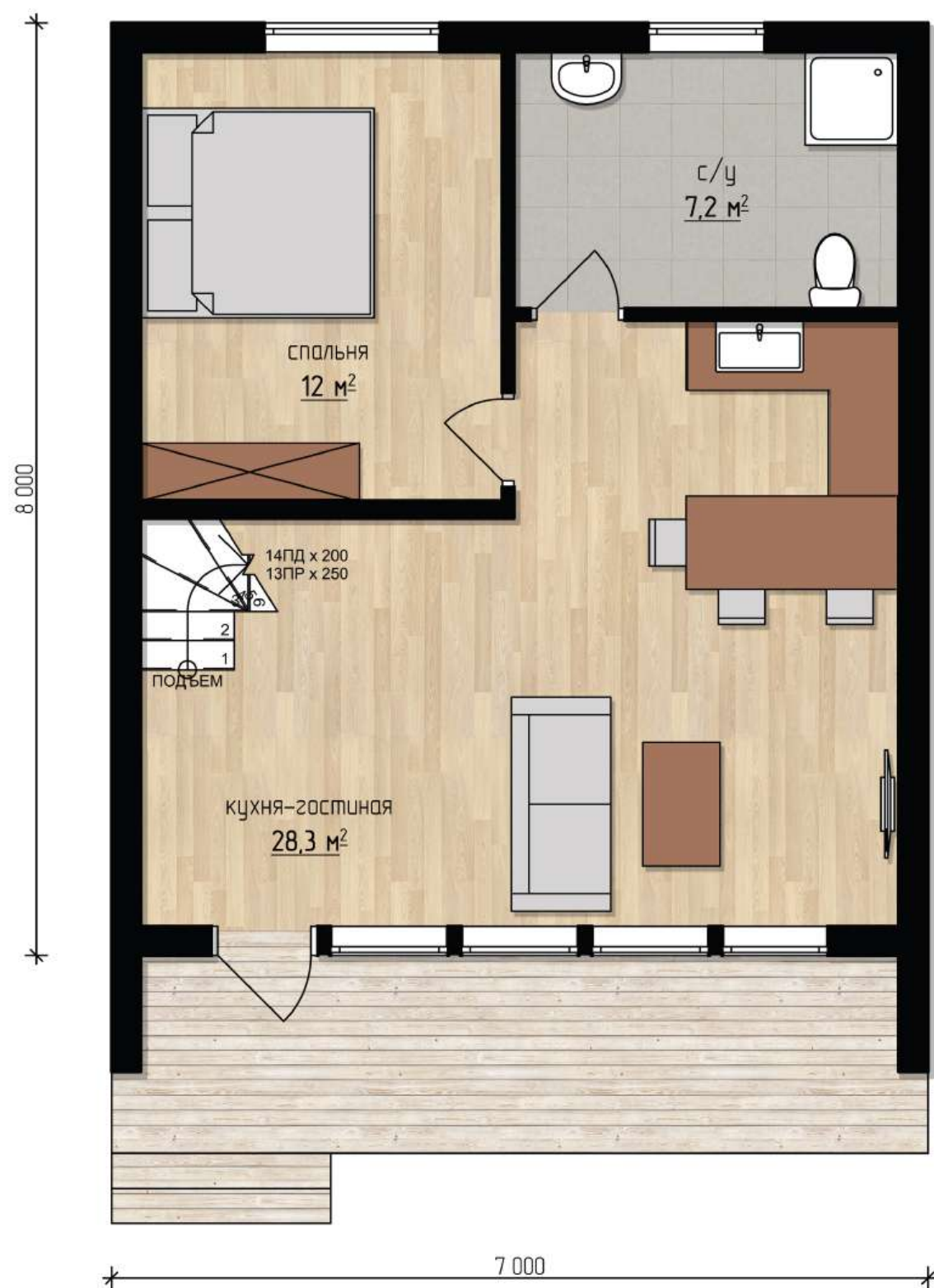
план первого этажа