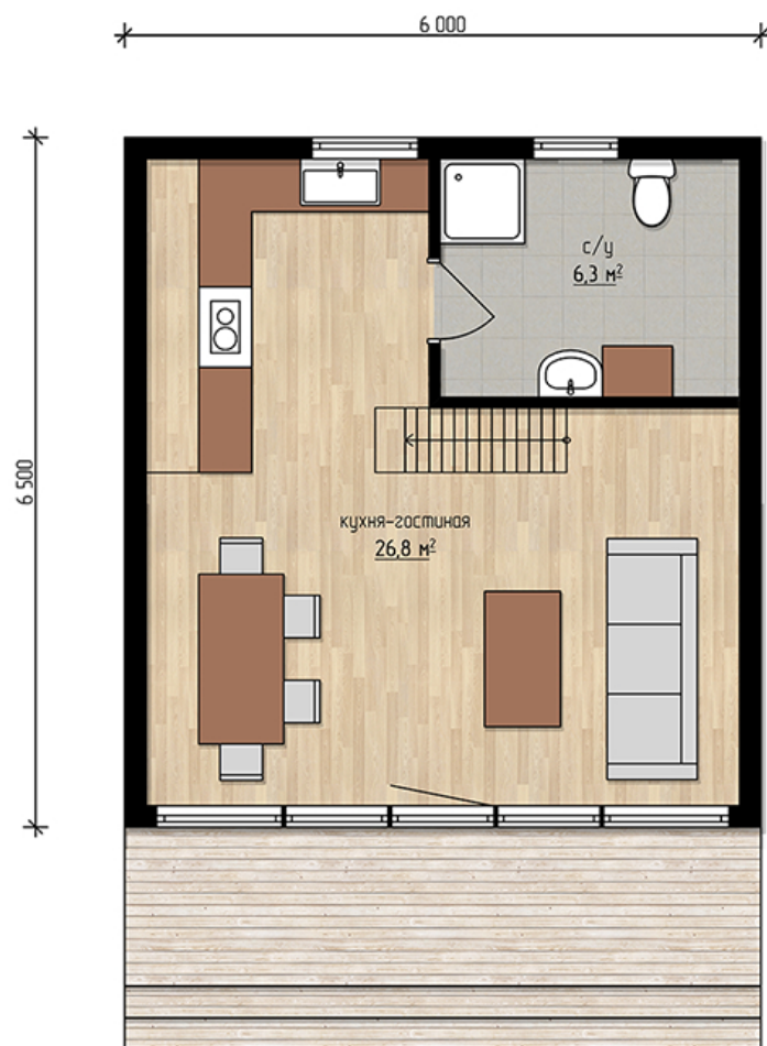
план 1 этажа